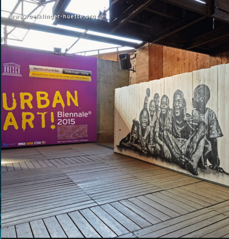
Jef Aérosol, Black is beautiful!, 2014

UrbanArt Biennale® 2015 bis 15. November 2015