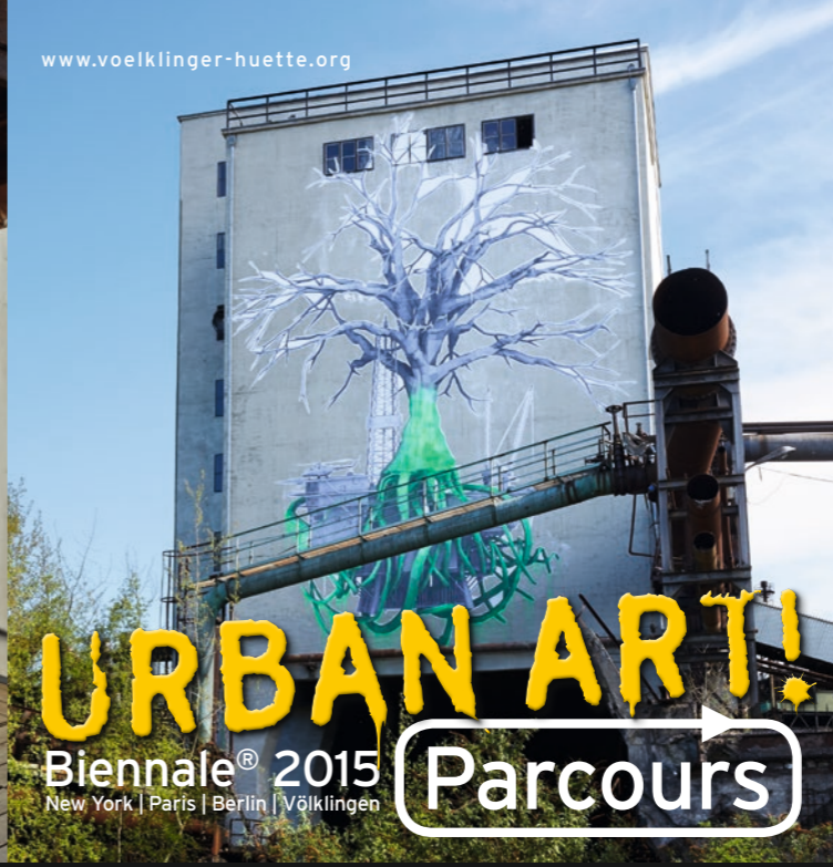
Ludo, Tree of Life, Höhe 30 m, 2015